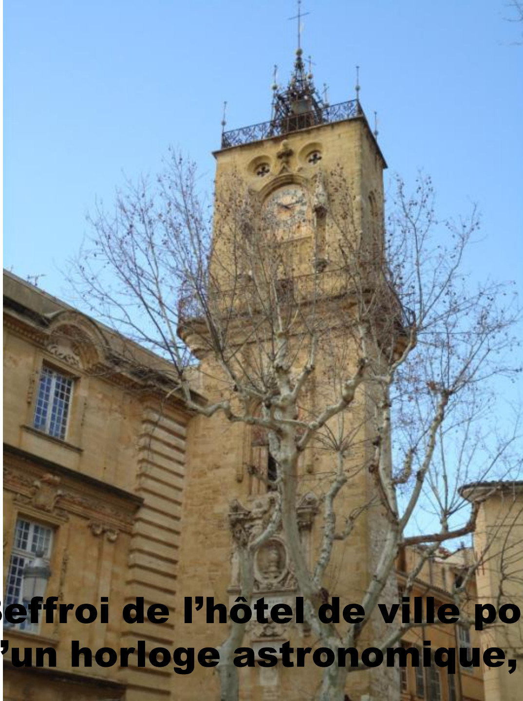
Beffroi de l'hôtel de ville pourvu d'un horloge astronomique, 1661