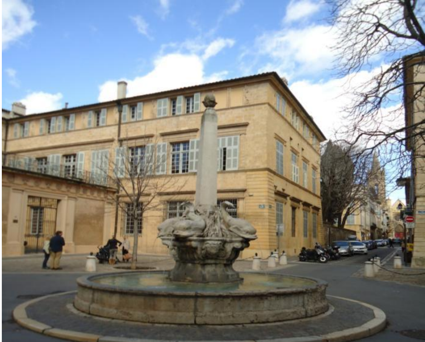
PLACE ET FONTAINE DES 4 DAUPHINS Édifiée en 1667. Bordée de plusieurs hôtels particuliers