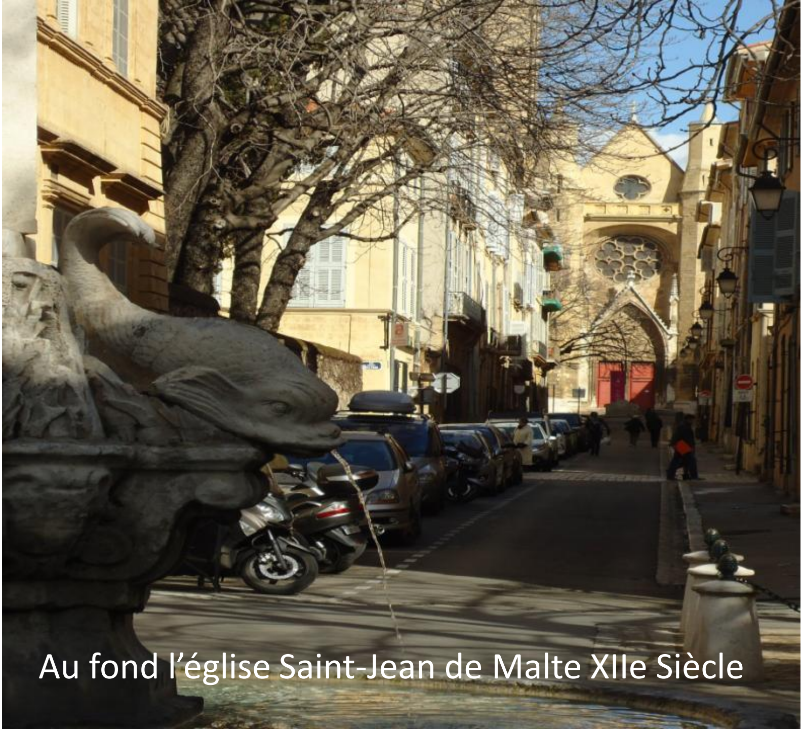
Au fond l'église Saint-Jean de Malte XIIe Siècle