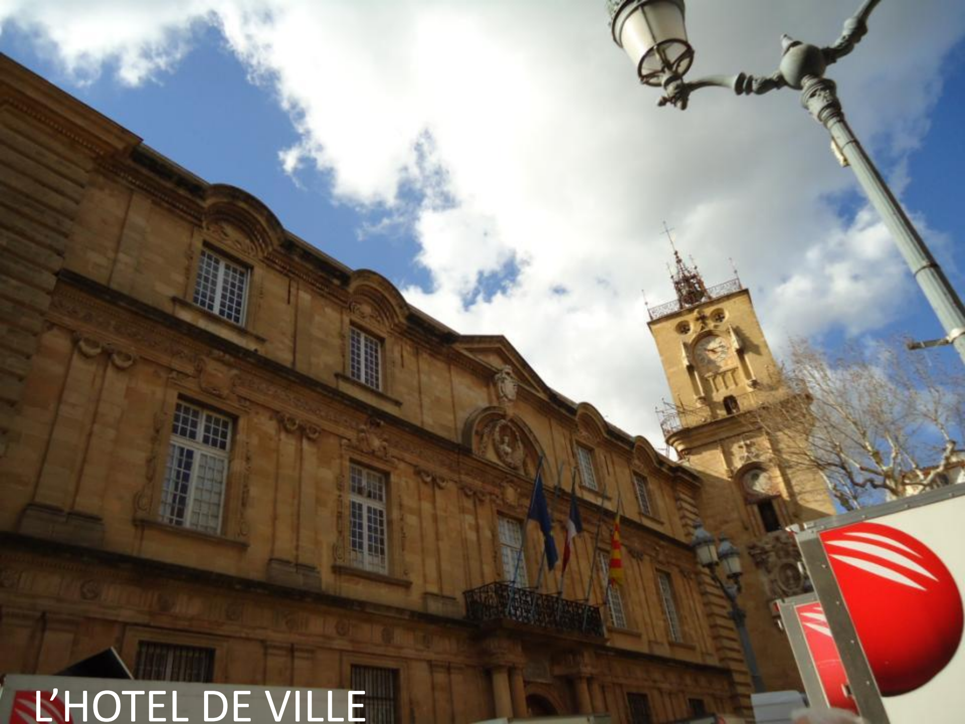
L'HOTEL DE VILLE